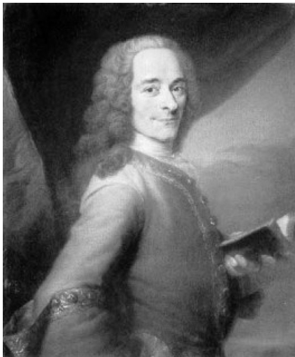
Портрет Вольтера (худ. Морис-Кантен де ля Тур)

впечатление, что, возвратившись во Францию, он завершает работу над книгой, в которой с достаточной определенностью формулирует свои философско-деистические и политические взгляды, связанные с идеями просветительства, религиозной терпимости и парламентаризма в рамках монархии. В 1733 году его книга под названием «Письма об английской жизни» была опубликована в Англии, а годом позже она вышла во Франции как «Философские письма», но вскоре была осуждена Парижской судебной палатой на сожжение. И это понятно: для своего времени «Письма» были одной из первых бомб, брошенных в феодальное общество. Для современной исторической и даже философской (несмотря на существование в ней различных направлений) науки Вольтер, идеализируя английскую конституцию и — отчасти — квакеров, четко призывал к веротерпимости, что для королевской Франции было ересью.